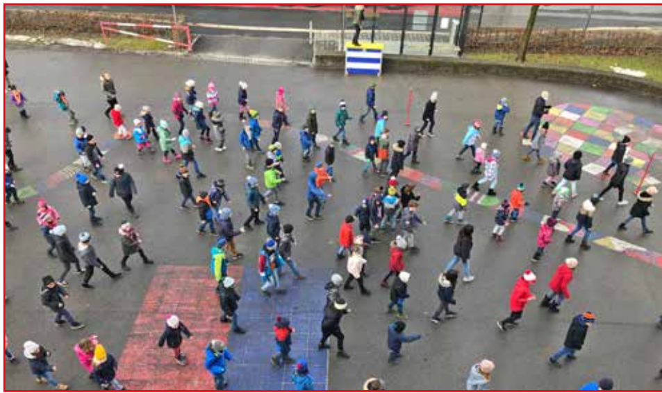
Was führt Kriessern hier im Schilde? Die hecken doch was aus?! Auflösung folgt in der nächsten Ausgabe...