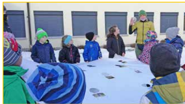
...in Oberriet ist der WWF zu Besuch «Tiere im Winter».